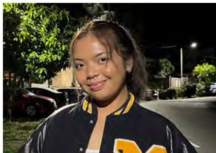
Mei | 马来西亚