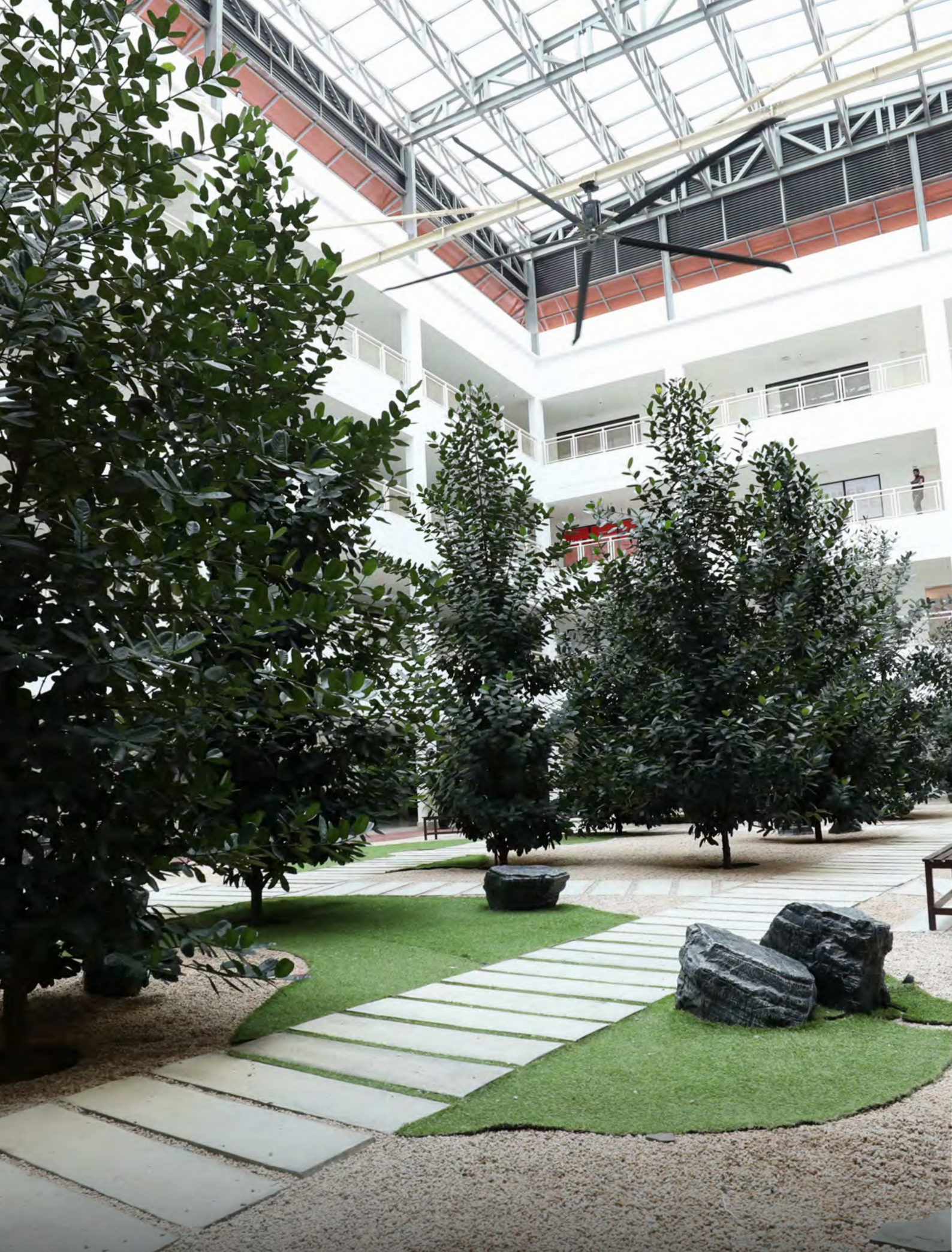
THE COURTYARD MEDINI CAMPUS, RAFFLES UNIVERSITY